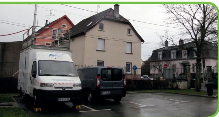
Le camion laboratoire a été installé sur l'esplanade des droits et libertés de l'homme à Audincourt durant l'année 2016.